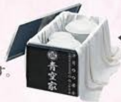
◀ 骨壺で3霊収蔵の場合

墓碑にはお好きな文字を入られます。厨子にはお骨壺で3霊、ご希望によりお骨壺のかわりに特製ご供養袋を使用することで8霊まで収蔵することができます。