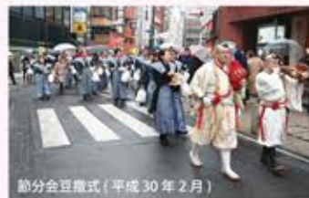
勤分会豆撒式(平成30年2月)