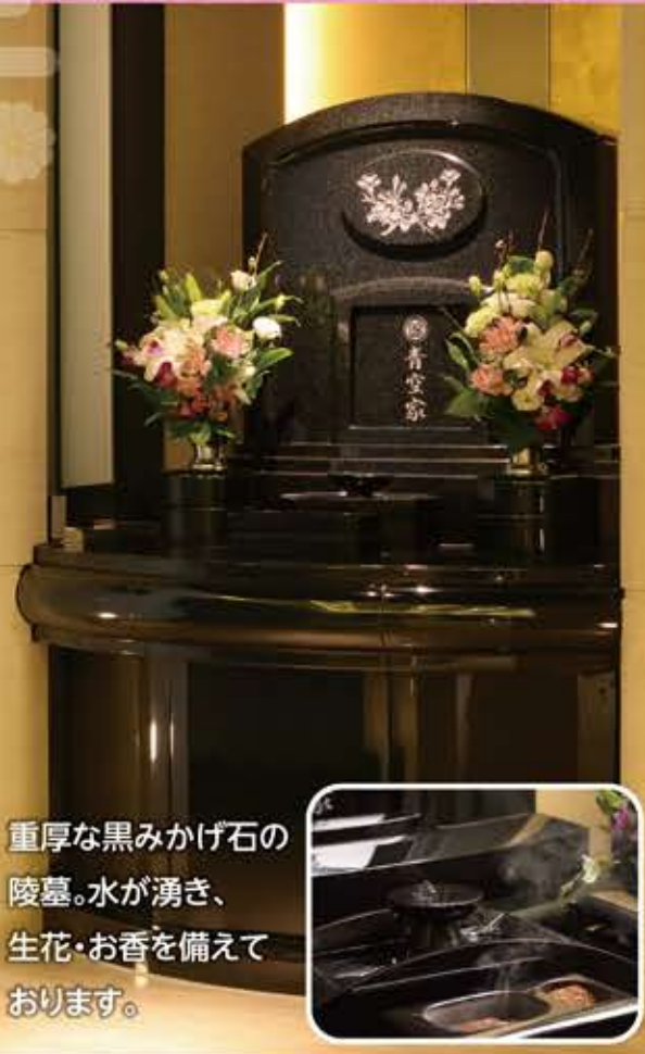
重厚な黒みかげ石の 陵墓。水が湧き、 生花・お香を備えて おります。